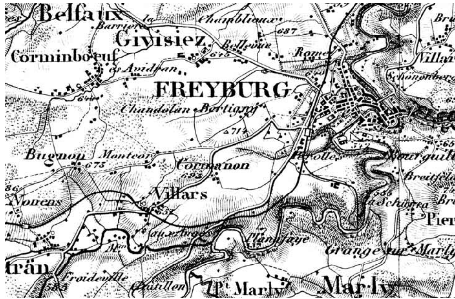
Fribourg, extrait de la carte topographique de la Suisse, 1875

Polymorphe et audacieux, le projet fribourgeois est unique en Suisse par le rôle de premier plan endossé par les communes membres, le canton ayant offert un soutien logistique et financier. Les rares exemples approchant, comme la politique du canton de Berne en matière d'agglomération, diffèrent justement par l'omniprésence et l'omnipotence des communes dans le processus fribourgeois. Celles-ci ont ainsi su piloter un projet en commun, au-dessus des clivages politiques et des guerres de clocher. Les mentalités ont dû évoluer très rapidement depuis le lancement des travaux de constitution en 2002 pour aboutir à un consensus général. Certaines communes ont préféré quitter le navire avant le terme des discussions, d'autres – telles Avry et Matran – ont demandé en cours de route à intégrer le périmètre provisoire. Les autorités communales ont au final accepté de céder une partie importante de leurs prérogatives. En cas d'acceptation des statuts de l'agglomération le 1 er juin, les dix communes se déchargeront de six domaines d'activités: l'aménagement du territoire, la planification des transports, la protection de l'environnement ainsi que la promotion touristique, la promotion économique et les activités culturelles.