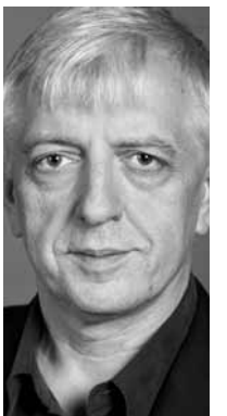
Ueli Leuenberger Conseiller national GE Président des Verts suisses

Nous avons un énorme travail à accomplir. Au vu des enjeux planétaires, notre action est plus nécessaire que jamais.