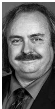
Luc Recordon Conseiller aux Etats VD

Les journalistes – il faut le reconnaître – ne ménagent souvent pas leur peine pour faire exister, au début et même assez longtemps après, les personnalités peu connues. C'est une