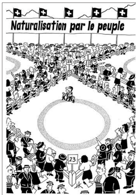
Dessin de Henning Kohberg, paru dans le Bulletin Vert 8.

Le 15 mai 1862, suite à une proposition du gouvernement libéral du canton, le Grand Conseil argovien décida à une forte majorité de créer deux communes