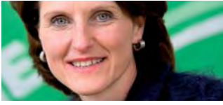
Franziska Teuscher Nationalrätin BE Vize-Präsidentin der Grünen Schweiz