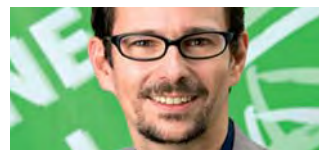
Balthasar Glättli Nationalrat ZH

Entsprechend ist der erste Schritt der Initiative – die Anhebung auf 5 obligatorische Ferienwochen für alle – wirtschaftlich gut verkraftbar. In den kommenden fünf Jahren soll der Ferienanspruch jährlich um einen Tag steigen, bis die sechste Ferienwoche für alle erreicht ist.