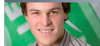
Bastien Girod Nationalrat ZH Grüne Schweiz