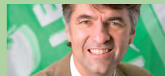
Alec von Graffenried Nationalrat BE

«Die Grünen unterstützen den Gegenvorschlag zur Volksinitiative 'Für Geldspiele im Dienste des Gemeinwohls', welcher das Glücks- und Geldspiel, die daraus resultierenden Einnahmen sowie die Kompetenzverteilung umfassend regeln will. Die Vorlage ist nötig, um die Gesetzgebung an die heutige Situation anzupassen. Die Einnahmen aus Geld- und Glücksspielen werden weiterhin in die AHV sowie Projekte und Förderung von Kultur und Sport fliessen. Deswegen stimme ich am 11. März Ja zum Gegenentwurf.»