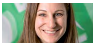
Adèle Thorens Nationalrätin VD

«Die Unterstützung kultureller Bestrebungen von gesamtschweizerischem Interesse durch den Bund ist explizit in der Bundesverfassung verankert. Die Grünen unterstützen in diesem Sinne die Buchpreisregulierung. Sie ist notwendig, um die Schweizer Verlage und die vielfältigen Buchhandlungen zu erhalten. Damit wird letztlich auch die heutige Vielfalt und Qualität der Bücher auf dem Schweizer Buchmarkt geschützt. Die Leserschaft profitiert von stabilen Preisen. Die Preisunterschiede gegenüber den Nachbarländern, welche die Buchpreise ebenfalls reguliert haben, nehmen ab. Aus diesen Gründen lehne ich das Referendum ab und stimme am 11. März JA zur Regulierung des Buchpreises.»